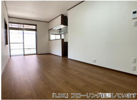
「LDK」フローリング新調しています