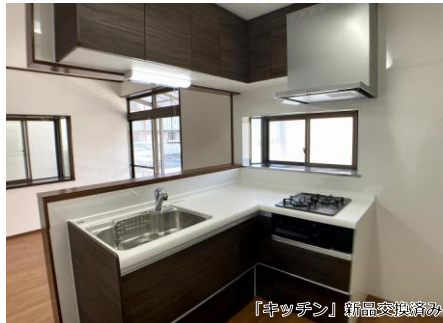
「キッチン」新品交換済み