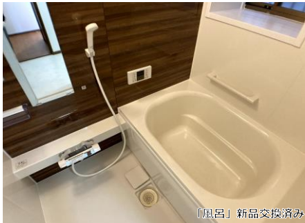
「風呂」新品交換済み