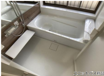
ユニットバス新品