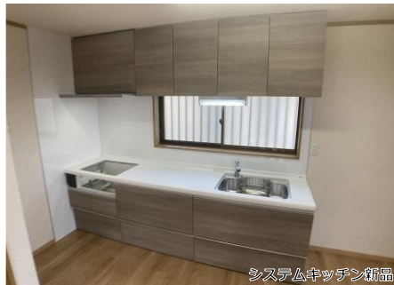
システムキッチン新品