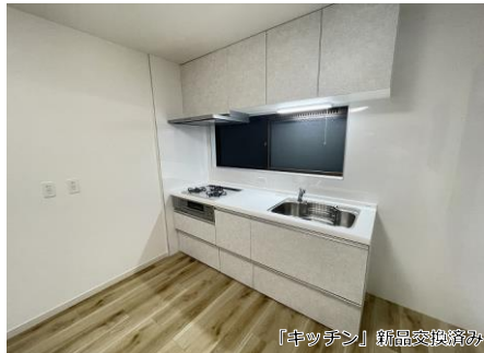
「キッチン」新品交換済み