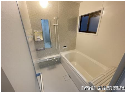
「浴室」新品交換済み