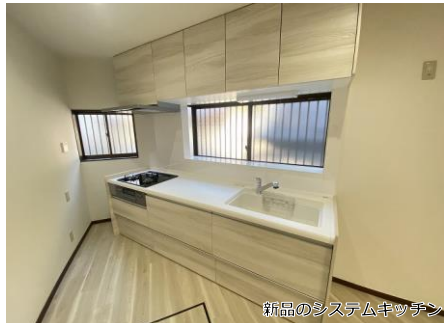
新品のシステムキッチン