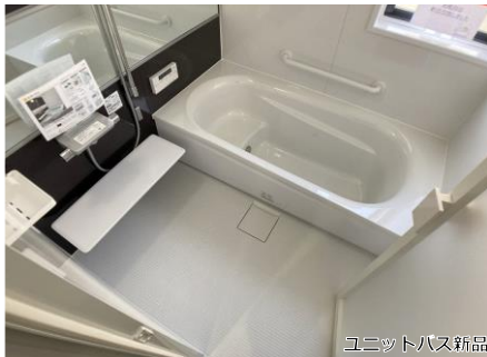
ユニットバス新品