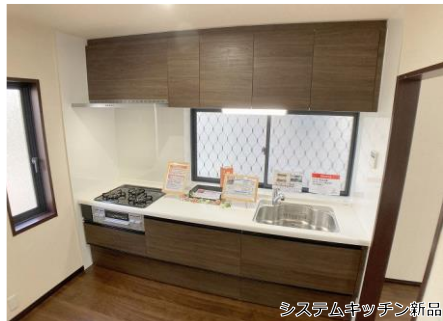
システムキッチン新品