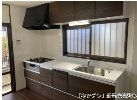
「キッチン」新品交換済み