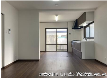
和室を無くしリビングを拡張しました