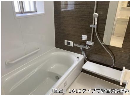
「風呂」1616タイプで新品交換済み