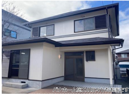
バナーリフォーム施工の広々としたお家です