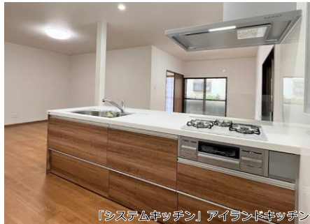
「システムキッチン」アイランドキッチン