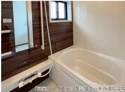
「浴室」ハウステック製ユニットバスに交換