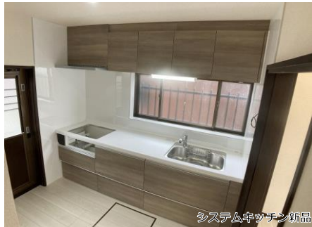
システムキッチン新品