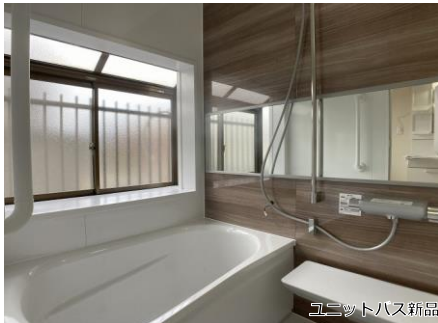
ユニットバス新品