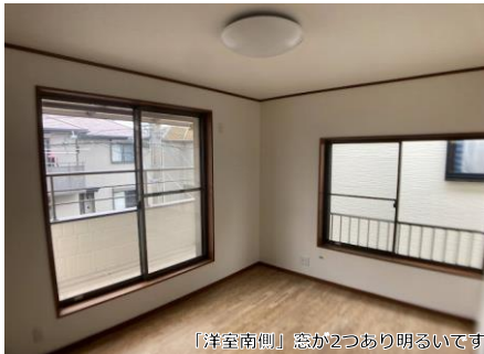
【洋室南側】窓が2つあり明るいです