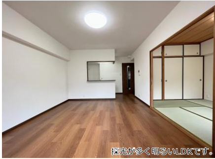
採光が多く明るいLDKです。