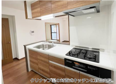
クリナップ製の対面式キッチンに新品交換。