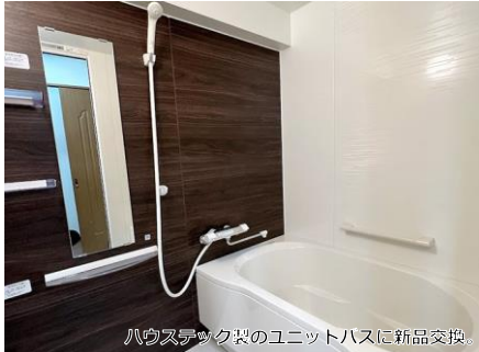
ハウステック製のユニットバスに新品交換。