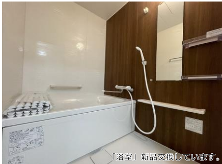
「浴室」新品交換しています。