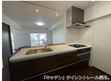
「キッチン」サイレントレール採用。