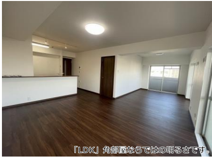
「LDK」角部屋ならではの明るさです。