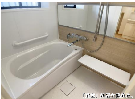
「浴室」新品交換済み。