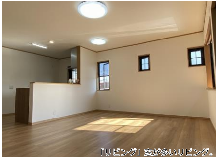
「リビング」窓が多いリビング。