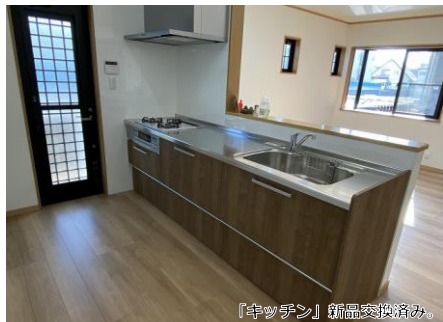
「キッチン」新品交換済み。