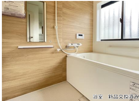
浴室 新品交換済み