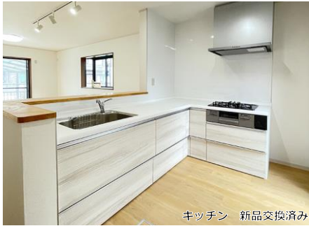
キッチン 新品交換済み