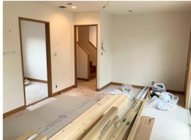
※写真はリフォーム前のものです。