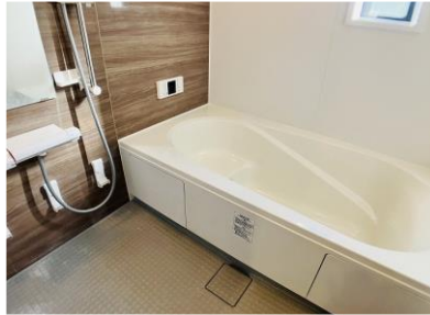
※写真はリフォーム前のものです。