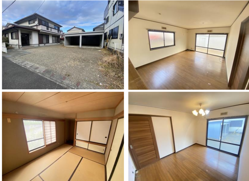
※写真はリフォーム前のものです。

駐車並列3台可能！全居室収納付き！軽量鉄骨メーカー施工住宅が月々6万円台から登場です！車で約5分にスーパー、徒歩圏内に医療施設やコンビニが揃い、生活環境も充実！