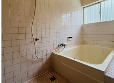
※写真はリフォーム前のものです。