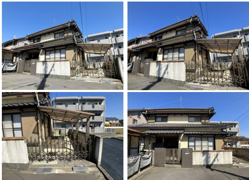
※写真はリフォーム前のものです。

角地で陽当り良好！全居室6帖以上の3LDK再生住宅が月々6万円台から登場です！JR予讃線「市坪」駅まで徒歩約7分！キッチン、お風呂など水回り新品交換済みです！