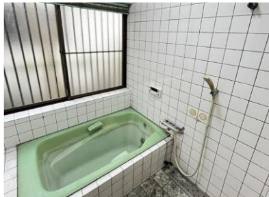
※写真はリフォーム前のものです。