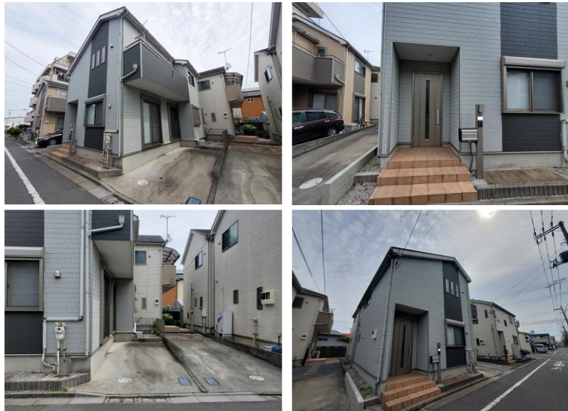
※写真はリフォーム前のものです。

4SLDKの再生住宅が登場です！ 湊江第一小学校まで徒歩約3分とお子様の通学も安心！ 徒歩圏内にスーパーや医療施設、コンビニが揃い、生活環境も充実しています！