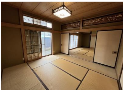
※写真はリフォーム前のものです。