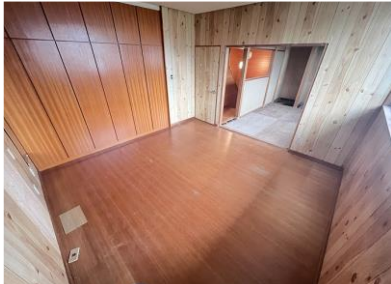
※写真はリフォーム前のものです。