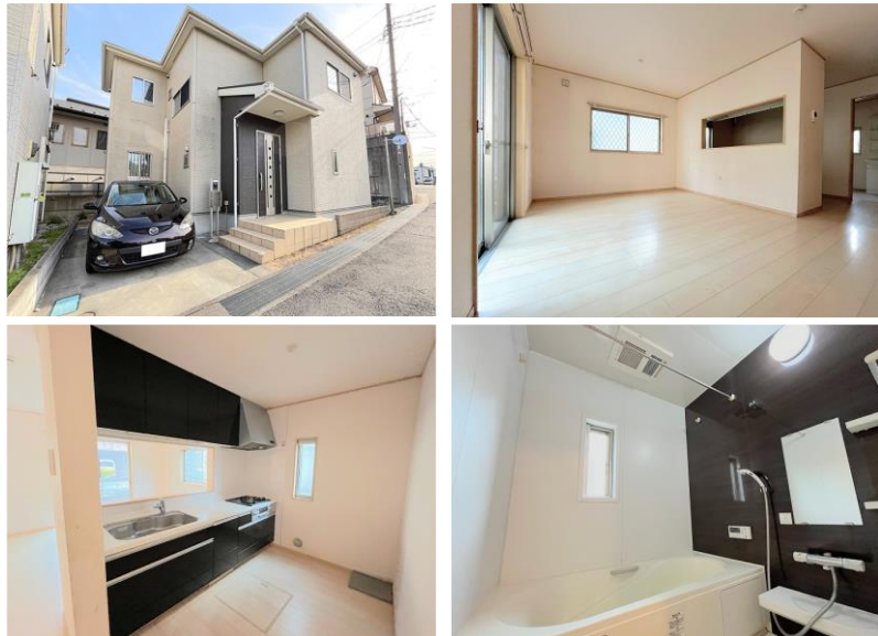
※写真はリフォーム前のものです。

全部屋6帖以上！角地の為日当たり良好な再生住宅が月々7万円台から登場です！イオンタウンふじみ野まで車で約3分！