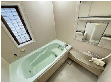
※写真はリフォーム前のものです。