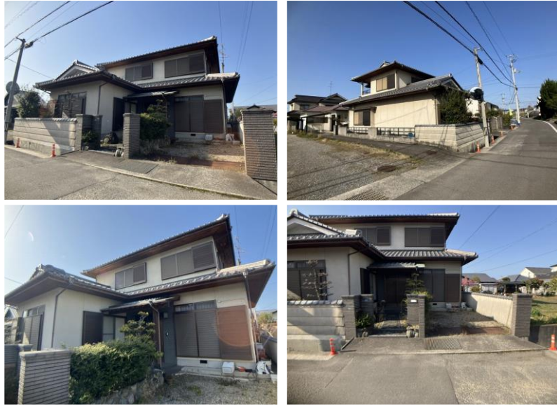
※写真はリフォーム前のものです。

建物ゆったり44坪！5SDK再生住宅が月々5万円台から登場です！駐車並列2台可能！